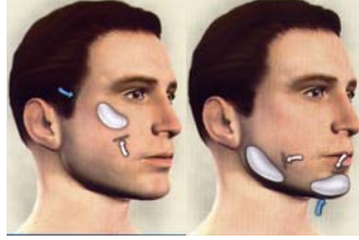
Fig: Implants positions for cheek and chin and jaw

सौंदर्यशास्त्रानुसार योग्य संतुलित चेहरा हा सुंदर चेहरा म्हणून ओळखला जातो. चेहेऱ्याची लांबी व रुंदी एक विशिष्ट प्रमाणात असते ज्यामुळे चेहरा अधिक आकर्षक व चांगला दिसतो. चेहरा संतुलित राखण्यासाठी गालावर इम्प्लान्टस् (Implants) बसविणे फायदेशीर ठरते. इम्प्लान्टस् तोंडातील छिद्रातून किंवा पापणीच्या खालून बसविले जातात. हे अशा प्रकारचे इम्प्लान्टस् एका दिवसातही बसवता येतात. बऱ्याचशा लोकांना आपल्याला पोक असलेल्या नाकाबरोबर आपली हनुवटी जास्त पुढे किंवा मागे (Over projecting or Under projecting) आल्याची जाणीव नसते.